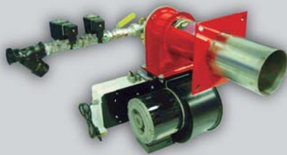
Quemador Monotobera Presurizado. Serie BJ 1

Diseñados con la última tecnología de combustión y transferencia, los MJ4 serie CHI , son calefactores horizontales indirectos , pudiendo trabajar a gas natural, GLP o gas oil. Construidos con cámara intercambiadora de acero inoxidable, los MJ4 serie CHI proporcionan gran volumen de aire a temperaturas moderadas, aptos para la climatización de grandes naves, criaderos, invernaderos, secaderos, piletas de natación y en todo lugar donde sea necesario un gran caudal de aire climatizado, libre de gases de combustión. Se los construye de 60.000 a 180.000 Kcal/h e incluyen control de temperatura de ambiente.