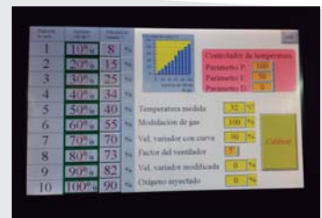
Control de proceso mediante PLC y pantalla HDMI

Nuestros paneles automáticos serie PAR, permiten el comando y control de quemadores simples (On/Off/Alto/Bajo fuego o modulantes). Todos los PAR contemplan protecciones electromagnéticas, contactores o arrancadores suaves, botones de conexión, luces de falla, llama o estado de periféricos. En determinados procesos incorporan pantallas HDMI con comunicación a PC y registro de datos. Los PAR, son ideales para el control y comando de su equipo de combustión obteniendo un comando seguro y una perfecta información del estado del proceso.