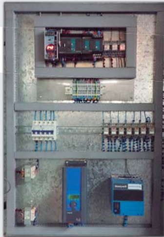
Paneles con uso de PLC y pantallas HDMI